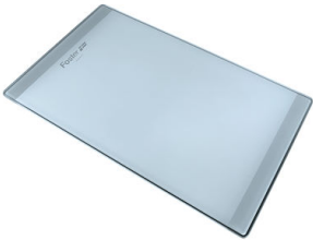
Planche de découpe en verre 8631 300